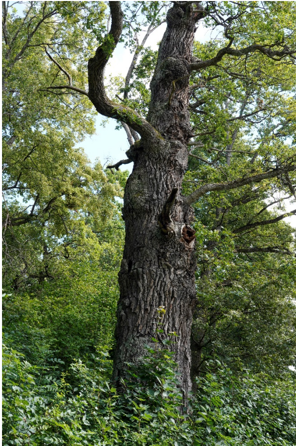
Figur 1. Nedanför områdets blockiga terräng växer grova ekar.

Det föreslagna biotopskyddsområdet är indelat i två delområden. Det östra området utgörs av mycket varierad skog som gradvis från norr till söder övergår från gamla och grova barrträd av tall och gran till lövskog med ek, skogslind, asp, lönn och björk. Ett påtagligt inslag av flerstammig skogslind visar på lång kontinuitet av trädslaget. Grova ekar står längs gångvägen nedanför branten på västra sida av området. Hasselbuketter med stora socklar växer spridda i hela området. Det västra området är lövdominerat och i brynzonerna finns gott om grova, gamla ekar. De grova ädellövträden utgör livsmiljö för ett flertal rödlistade arter som oxtungsvamp (NT, nära hotad) och skeppsvarsfluga (NT). Även mindre hackspett (NT) trivs i området.