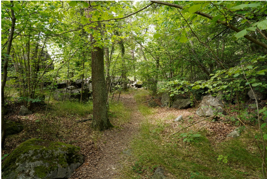
Figur 2. I Åkeslund finns en mycket varierad skog med olika trädslag, hassel och stenblock.

Området ingår i Brommas De Geermorän-system som utgör ett riksintresse för naturvård (3 kap. 6 § Miljöbalken). I det västra delområdet finns två partier med ett stort antal block. Det största, som är spräckt i två delar, har brutits loss från den intilliggande hällen och ställts på högkant, så att den av inlandsisen slipade och räfflade ytan nu står vertikalt och är vänd mot söder. Den intilliggande hällen är delvis uppsplittrad i stora tätt liggande block. Det östra delområdet består av bitvis mycket blockrik morän med blocksträngar och förekomst av ett flertal jätteblock. Knappt 100 meter väster om Fredrikslundsvägens ände står ett cirka nio meter högt granitblock, kallat Atle-Tor, på högkant som en pelare. Lite längre söderut finns ett par mindre blockpelare kallade Tors Bockar samt Lasse-Maja-stenen. Atle-Tor och Lasse-Maja-stenen utgör övriga kulturhistoriska lämningar.